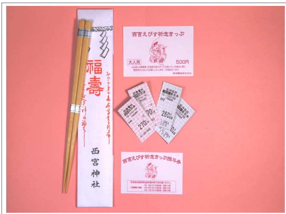
「西宮えびす祈念きっぷ・縁起物（福箸）」写真 写真の乗車券は「基本版」（大人用）