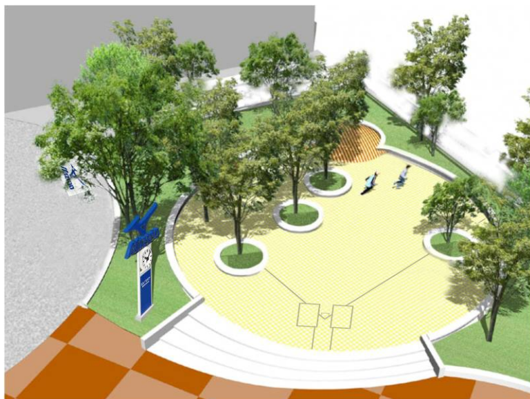
「ミズノ スクエア」完成予想図