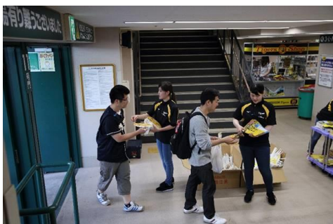
抽選付きうちわの配布(昨年の様子)