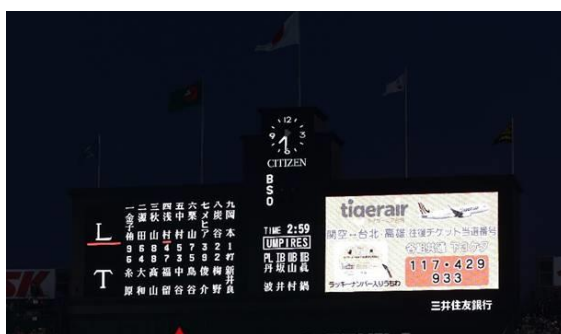
場内ビジョンで当選者の発表(昨年の様子)