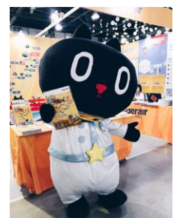
タイガーエア台湾とコラボの 新しい仲間 クロロ