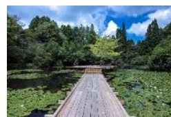
川俣正《六甲の浮き橋とテラス》

過去最多となる招待・公募を合わせた60組以上のアーティストの参加を予定しています。国内外から幅広い視点で活動しているアーティストの作品をご紹介します。また、公募作品の募集条件を向上し、より優れた作品を募集・展示します。