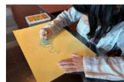
こどもプログラム

ワークショップ等を通じて自然の中で子どもたちが現代アートに触れられる機会を増やし、次世代の文化芸術の担い手や支え手を育てていきます。