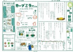
《あつめや新聞》2023年、京都