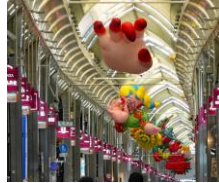
《夢黄梁》2023年、 寺町京極商店街美術館