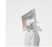
《Food Hood》2023年、 MITTSU PROJECT、Spiral(東京)