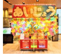
《愛おもう屋台》2018年、 Tokyo Midtown Award 2018