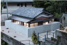
《埋まる家》2022年、 撮影: yujiro ichioka