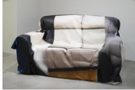
《Package》2023年、 公益財団法人クマ財団