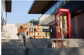
《Telephone After All》2022年、 GREEN SPRINGS