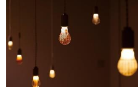
《電球都市》2014年、 Bulb Cities、遊工房アートスペース