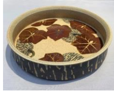
《鉄絵南瓜文鉢》2024年、 第55回東海伝統工芸展、愛知