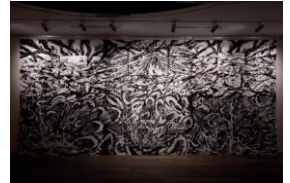
《NO-COUNT》2021年、 UNPEL GALLERY