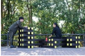
《活動の積み木》2022年、 撮影: Tomoko Hirayanagi