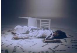
《混沌と調和》2022年、 Crocodile House, Singapore