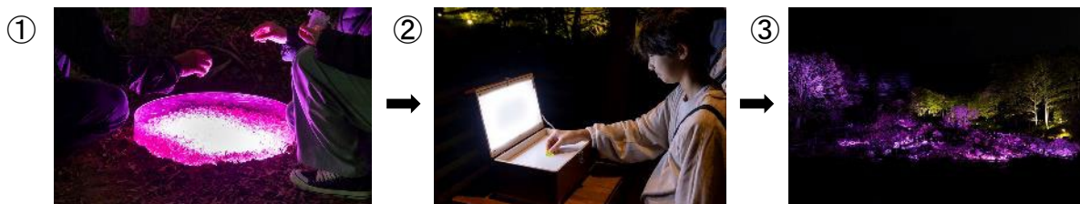
高橋匡太《キラ★キラ★キラリー～夜の絵具を探せ！～》2023年

本作品は、来園者が園内を巡って、キラキラ光る色のかけらを集める体験型のアート作品です。園内にある5箇所の「光の泉」(写真①)を全て周り、ゴール地点(写真②)へ行くと、光と音楽(mica bando 作曲)の特別な演出(写真③)が鑑賞できます。来園者が能動的に作品に関わることで、より印象的な体験ができる作品です。小さなお子様を含めた幅広い世代の方にお楽しみいただけます。