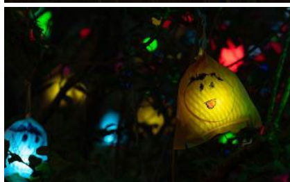
高橋匡太《ひかりの実 in SIKI ガーデン》2023年