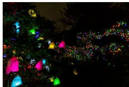
高橋匡太《ひかりの実 in SIKI ガーデン》 2023年

本作品は笑顔が描かれた果実袋の中に、LED の小さな光を入れて木々に取り付け、あたたかな夜景を作り出します。今年も神戸市内の小中学生などが制作に参加し約5,000の《ひかりの実》を会期を分けて2,500ずつ展示します。一人ひとりが参加することによって夜景が作られ、沢山の笑顔と癒やしの風景を創る展示作品です。エリア内を音楽家 mica bando 作曲による、やさしいハーモニーの音楽が満たしてあたたかな光と音に包まれます。