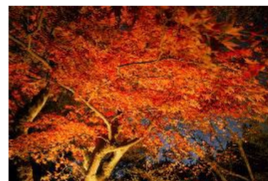
ライトアップイメージ

「ひかりの森～夜の芸術散歩～」会期中、会場内の木々のライトアップを実施します。会場内に展示されている作品とともに、紅葉ライトアップがお楽しみいただけます。