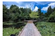
川俣正《六甲の浮き橋とテラス》

過去最多となる招待・公募を合わせた61組のアーティストが参加します。国内外から幅広い視点で活動しているアーティストの作品をご紹介します。また、公募作品の募集条件を向上し、より優れた作品を募集・展示します。