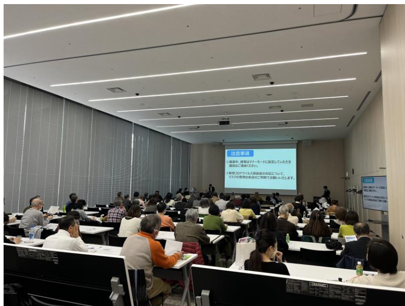
前回開催の様様（2024年3月）