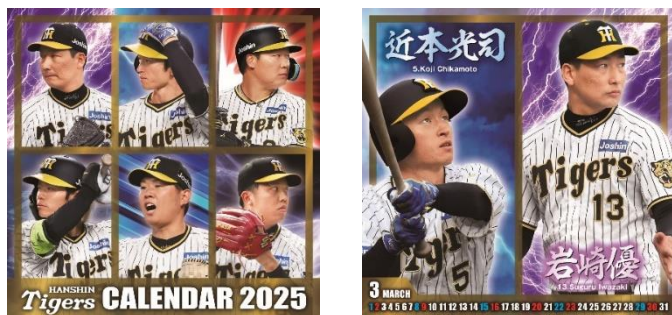
阪神タイガース カレンダー 2025(デスクタイプ:表紙・3月オモテ)

表面は選手の表情豊かなフォトタイプ、裏面はスケジュールが書き込める選手の誕生日入り卓上カレンダー。