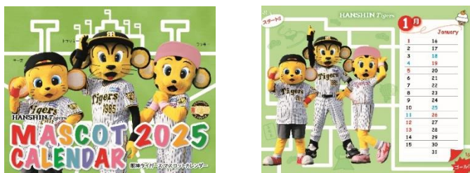
阪神タイガース カレンダー 2025(マスコットタイプ:表紙・1月オモテ)

阪神タイガースマスコット、トラッキー・ラッキー・キー太の明るく元気な写真とイラストが満載の卓上カレンダー。