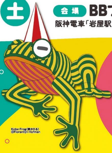
Kobe Frog(美かえる) ©Florentijn Hofman