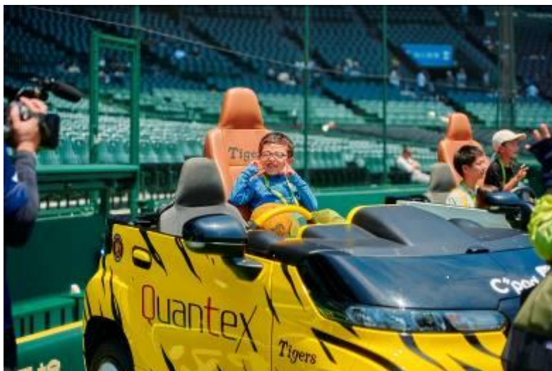
〈リリースカー 撮影イメージ〉

「阪神甲子園球場 フォトジェニックイベント」の詳細は、次ページ以降のとおりです。