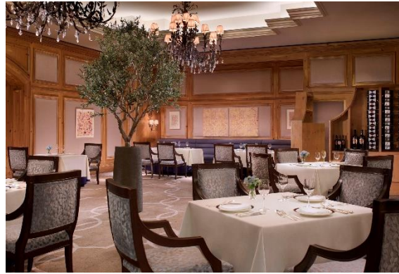
イタリア料理「スプレンドィード」