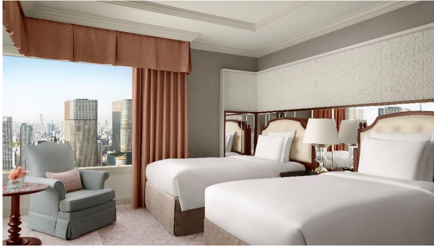
エグゼクティブスイート ベッドルーム(ツイン/上層階)