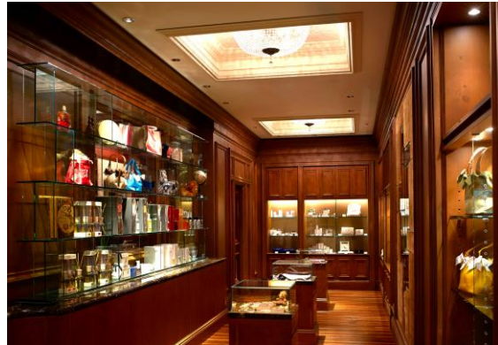
ザ・リッツ・カールトンブティック