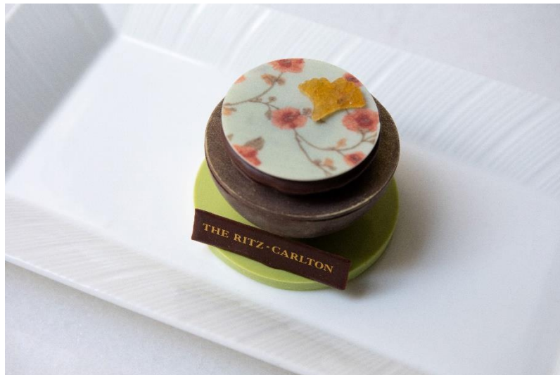
ウエルカムアメニティ