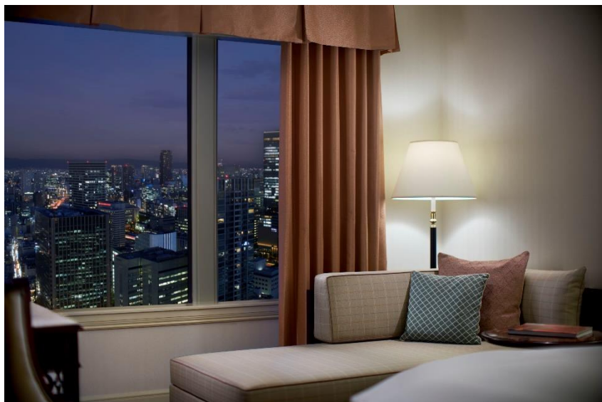
上層階客室のソファークラフト

クラブフロア(33F~35F)及びスカイビューフロア(36F、37F)の上層階客室には、ソファークラフトを設置。ベッドとしてもお過ごしいただくことができます。