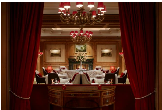
フランス料理「ラ・ベ」