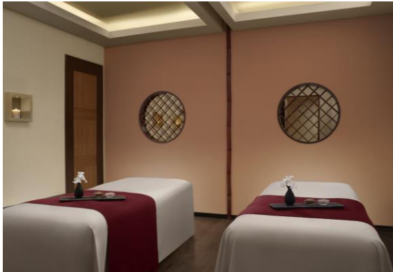
スパ&フィットネス