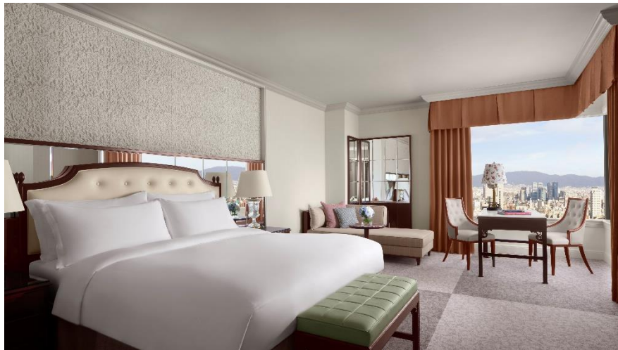
デラックスルーム(上層階)

デスクには白色の天板を設置。ヘッドボードミラーとともに、自然光と照明の反射を利用して明るさを増幅させます。また、装飾壁の間接照明が客室全体に柔らかな雰囲気をもたらします。