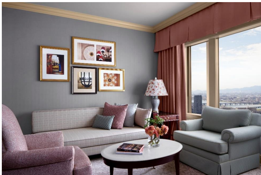
エグゼクティブスイートルーム リビングルーム(上層階)

エグゼクティブスイートの客室入口の壁紙は、お客様を出迎える温かみのある色で、その柔らかな色合いは、心地よい安らぎをもたらす旅の疲れを癒します。寝室の壁紙とカーペットはオフホワイトとウォームグレーのツートンカラーを取り入れ、ベッドエリアとリビングエリアの色を巧みに変えることで、空間の広がりや立体感を演出。ベンチシートはボタニカルカラーの緑色に張り替え、客室のアクセントとし、客室内に自然の息吹を感じさせます。