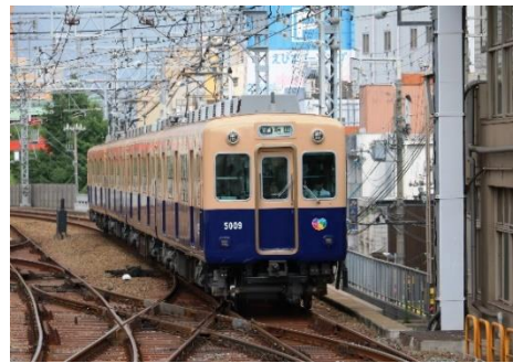
阪神 5001 形（青胴車）

※営業最終運行日につきましては、2025年1月上旬頃に、改めてお知らせする予定です。