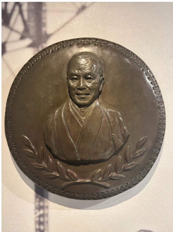
近藤兵太郎氏 台湾棒球名人堂殿堂入りレリーフ（レプリカ）