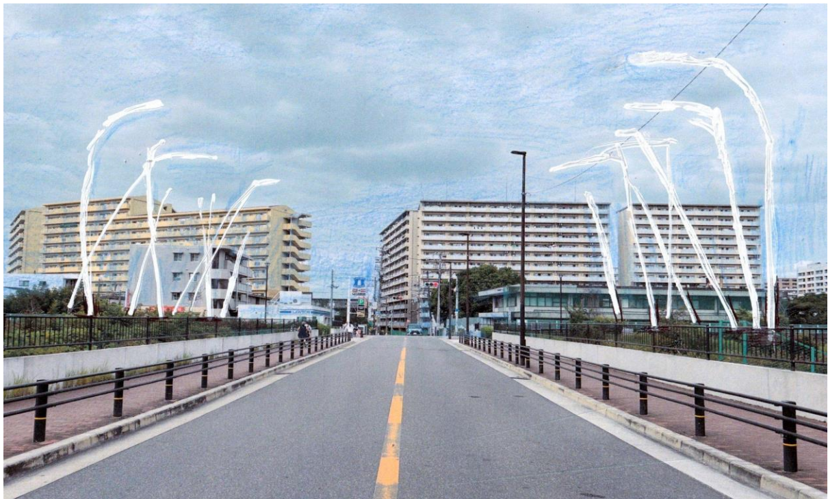
アーティストによるイメージドローイング

株式会社POS建築観察設計研究所（本社：大阪市此花区、社長：大川輝）及び、株式会社ウェルビーイング阪急阪神（本社：大阪市福島区、社長：石原敏孝）で構成する正蓮寺川公園アートプロジェクト事業連合は、大阪市此花区役所が主催する「正蓮寺川公園アートプロジェクト『konohana permanentale100+』」の本格実施となる第1弾パブリックアート制作として、川俣正氏による新作《千鳥橋ライトポスト》の作品発表を下記の通り行います。