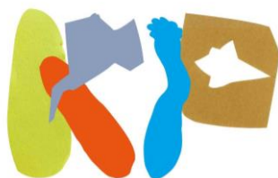
konohana permanentale 100+

近畿大学の学生と此花区に住む小学生が共同制作したロゴ。企業ロゴのように単一のイメージを一方向的に押し付けることなく、さまざまなアート作品が混在するkonohana permanentale 100+の多様性を、複数の小学生が折り紙をちぎったかたちを組み合わせた文字で表現。既存書体をつかわない自由なこの文字は複数のバリエーションを持ち、状況によってかたちを変えます。温もりを感じさせ気取りのないこのロゴは、此花の街のもつ人間らしさを表象し、ふだん芸術祭となじみがない人たちに対しても親しみやすさを訴求します。