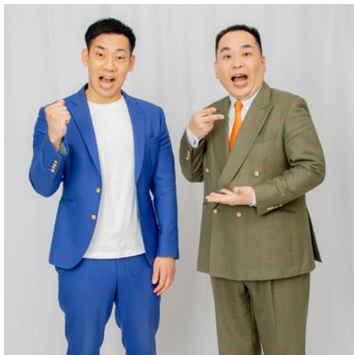
【ミルクボーイ】 ＜駒場孝さん＞ ＜内海崇さん＞

2025 シーズンの阪神甲子園球場内のグルメ・グッズを紹介する「甲子園グルメ大使」として、 M-1 グランプリ 2019 王者「ミルクボーイ」の駒場孝（こまばたかし）さんと内海崇（うつみたかし）さんが新たに就任しました！ お二人が大喜利も交えながら和気あいあいと甲子園球場の魅力伝える PR 動画は阪神甲子園球場公式 SNS にて公開中です！