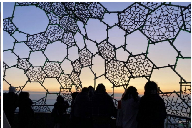
左：六甲ケーブル六甲山上駅「天覧台」、右：「自然体感展望台 六甲枝垂れ」から望む初日の出の様子