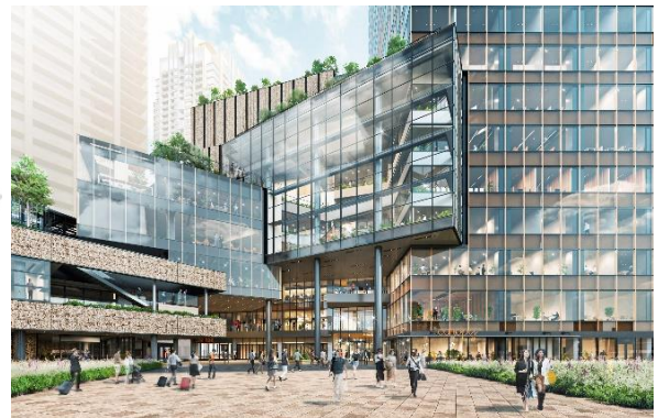
図3：グラングリーン大阪 ショップ&レストラン北館