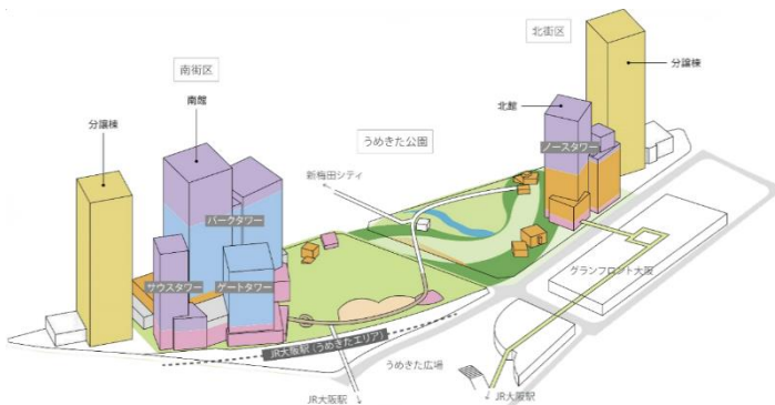
図2：グラングリーン大阪 全体図

JR 大阪駅北側に広がる旧梅田貨物駅跡地において、グラングリーン大阪開発事業者 JV9 社が開発を進めるうめきた2期地区開発事業です。先行まちびらきでは、北館及びうめきた公園の一部（サウスパークの全面、ノースパークの一部）がオープン予定です。このうち北館は、北街区のホテル・中核機能施設・商業施設を備えるビルのことを指します。